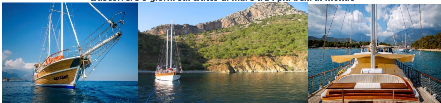
Caicco Beyzade – 26m Lunghezza – 8 Cabine Doppie

Consulta il programma dettagliato delle nostre rotte che troverai in basso e scegli quello più adatto a te per trascorrere 8 giorni sul tratto di mare tra i più belli al mondo